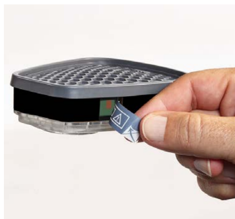
3M™ 有機ガス用吸収缶 6001i-J（左）と破過確認ウィンドウ（右）

防毒マスクは有機溶剤の蒸気やガスから身体を保護するため、塗装作業、化学メーカーでの有機溶剤取り扱い作業によって使用されており、3Mの防毒マスクは幅広いカテゴリーの作業者に愛用されています。