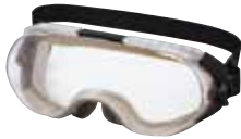
保護めがね/ ゴーグル