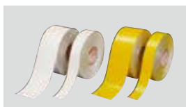
標示材 3M™ 床用標示テープ