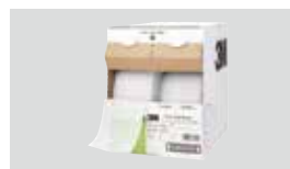
ダスターシステム製品 3M™ イージートラップダスター