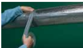
テープ・接着剤製品 スコッチ® ダクトテープ