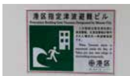
標示材 3M™ 海抜・避難場所標示用 反射シート