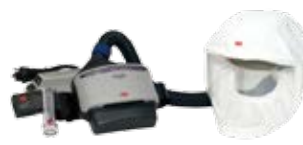
電動ファン付き 呼吸用保護具