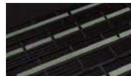
標示材 3M™ 蓄光性貼付式シート