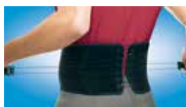
サポーター製品 FUTURO™ 腰用サポーター