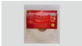
空気清浄フィルター フィルタレット™ 空気清浄フィルター