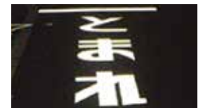
標示材 3M™ 路面標示材