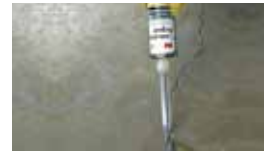
コンクリート補修剤 3M™ コンクリートリペア 600