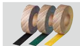
滑り止めテープ 3M™ セーフティ・ウォーク™ すべり止めテープ