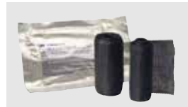
ケーブル・管路等 補修・補強テープ 3M™ アーマーキャスト 管路補修・補強テープ