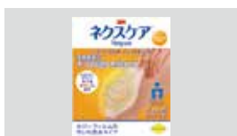
家庭用創傷パッド ネクスケア™ ハイドロコロイドメディカルパッド