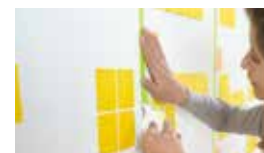
強粘着ノート ポスト・イット® 強粘着ノート

*: 本製品は、衣類の表面に付着した火山灰等は除去可能ですが、繊維間に入り込むような細かい灰は、粘着剤に触れないため除去できません。