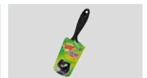
粘着クリーナー製品 スコッチ・ブライト™ ベタコロ™ 粘着クリーナー*