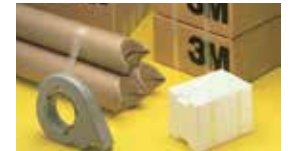
テープ・接着剤製品 スコッチ® フィラメントテープ