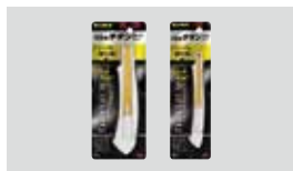
チタンコートカッター スコッチ® チタンコートカッター