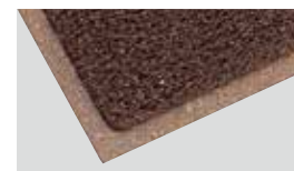
マット製品 3M™ ノーマッド™ マット エキストラ・デュエティ