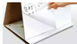
ミーティングツール ポスト・イット® イーゼルパッド