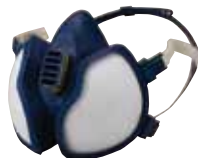
ガスマスク/ 防毒マスク