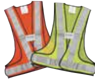
高視認性 反射ベスト