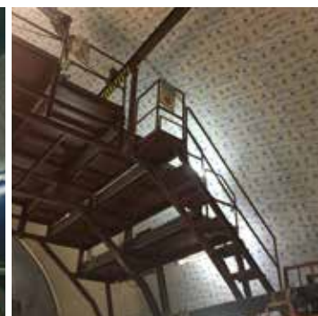
NATMトンネル等、湿潤度の高いコンクリート表面に対応した新製品 2227HPW