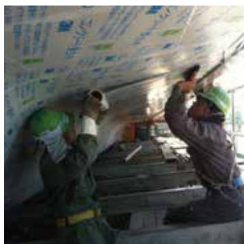
橋梁での貼り合わせ作業