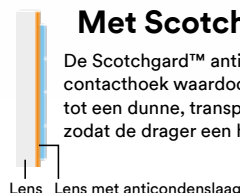
Lens Lens met anticondenslaag

De Scotchgard™ anti-condenslaag vormt een beperkte contacthoek waardoor waterdruppels afgevlakt worden tot een dunne, transparante film die het licht doorlaat zodat de drager een helder zicht heeft.