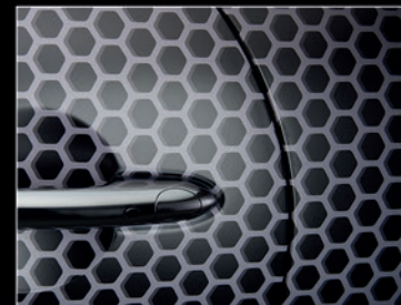
▲ Gleichmäßige Schnitte in Lücken zwischen Karosserie-Segmenten