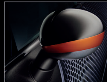
▲ Schafft einmalige Akzente und Gestaltungsmöglichkeiten