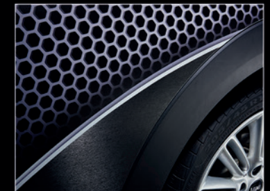
▲ Für saubere Stoßnähte zwischen zwei anspruchsvollen Folien