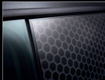
▲ Schafft einen gleichmäßigen Rand zwischen Fenstergrafiken und Fenstergummis