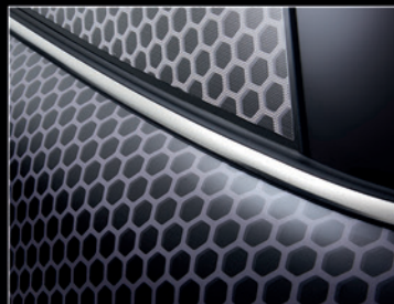
▲ Folgt den Konturen und Kurven auf allen Fahrzeugteilen