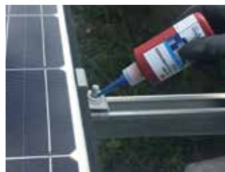
ボルトに数滴塗布してください。