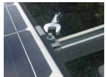
通常と同じようにレンチなどで締めつけます。