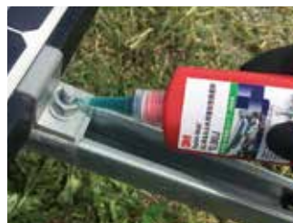
ナットの上から数滴塗布してください。