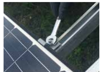
工具を使って取り外してください。