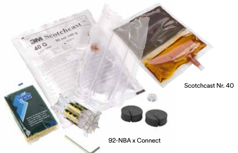
Scotchcast Nr. 40

Fragen Sie auch nach anderen 3M™ Scotchcast™ Verbindungs- und Abzweiggarituren!