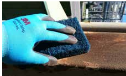
ゴシゴシカを入れて削っても・・・