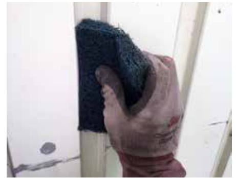
狭所や凹凸部分のケレン