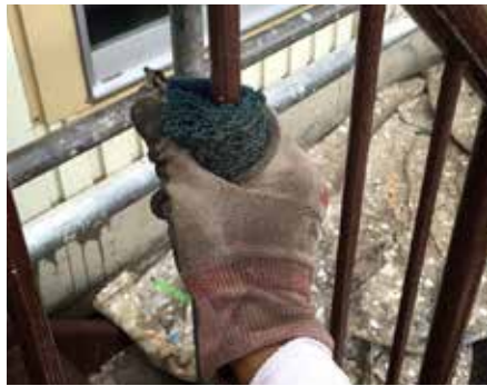
手すりや鉄格子、パイプのケレン