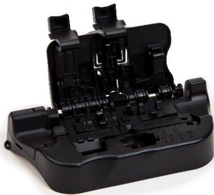
3M™ Easy Cleaver