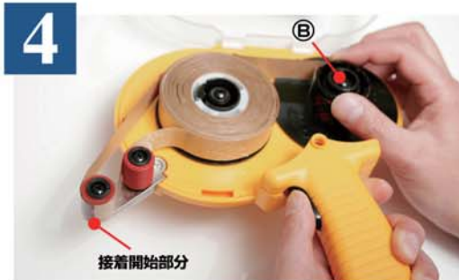
4 黒色の引き金を引きながら③を回し、ローラーの先端に接着開始部分を合わせます。