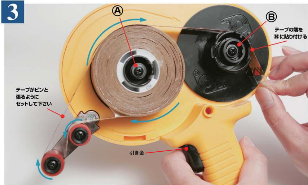
3 ④の3本ツメにテープ芯をはめ込み、黒色の引き金を引きながら上記のようにテープを通し、テープ端を③に巻き付けます。 ※テープを通す際、テープがたるまないように注意してください。