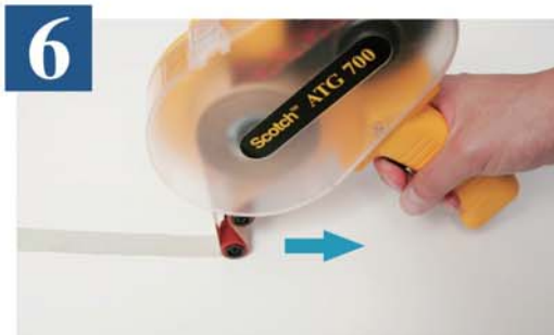
6 黒色の引き金を引きながらテープを貼ります。 テープを切る時は、引き金を離し、アプリケータをそのまま手前方向に引いてテープを切ってください。 (アプリケータを上から離してテープを切らないようにしてください。)