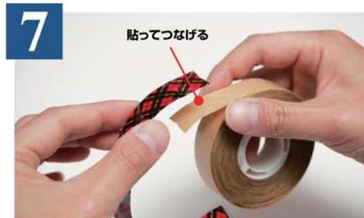
7 途中でテープが切れた場合はテープ最初の赤いチェック部分につなぎ直し、最初からセットし直してください。