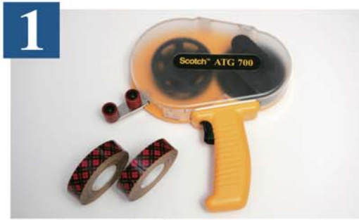
1 ATG 700 両面テープアプリケータ