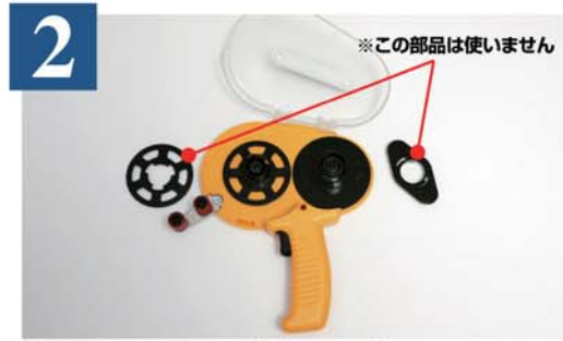
2 透明カバーを開けてリール付属部品を取り外してください。 ※ご使用の際に、この部品は不要です。