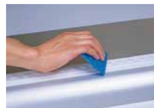
④ スクイジー、ローラー等でリベット周りの空気を押し出しながら圧着します。