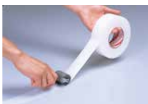
① 保護シートがテープ本体の外側にある状態 (出荷時の状態) でテープを巻きだします。保護シートがついたままの状態です。ローラー、スクイジー等で空気を押し出しながら貼り付け、圧着します。