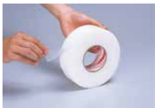
① テープロール最外周にある保護シート (ライナー) のみを剥がします。