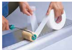
③ 粘着剤面から保護フィルムを剥がしながら、クッション性のあるローラーで軽く圧着します。