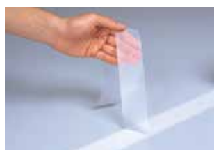
② テープを十分に圧着した後で、アイオノマーフィルム上の保護フィルムを剥がします。