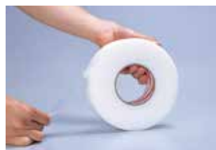
② 保護シートのみを一周分割し、保護シートがテープの内側になる状態にします。