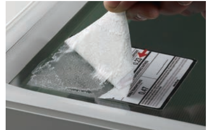
テープ・ステッカー剥がし