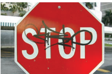
油性ペン落書き跡の消去