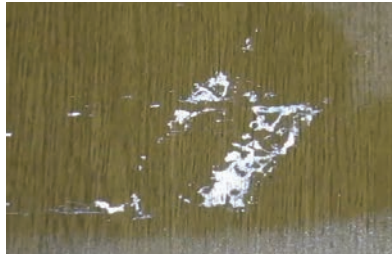
接着剤・テープののり残り除去