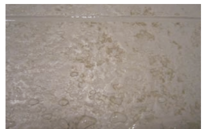
浴室床の油脂汚れ落とし