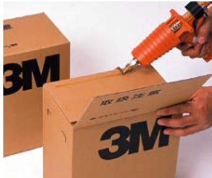
● 段ボールの封函に(Lチップ使用)