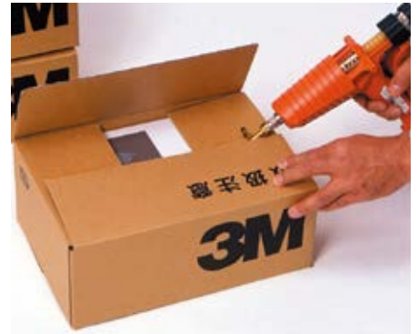
● 段ボールの封函に(Tチップ使用)