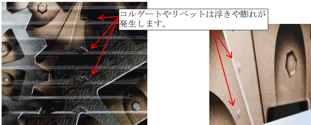
写真1 凹凸の大きい部分の例