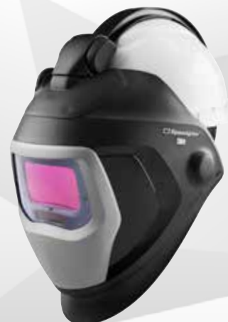
3M™ Speedglas™ Welding Helmet 9100-QR