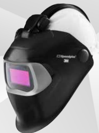
3M™ Speedglas™ Welding Helmet 100-QR