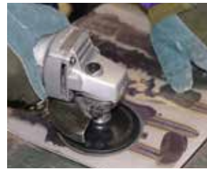
TS ディスクでのビード除去