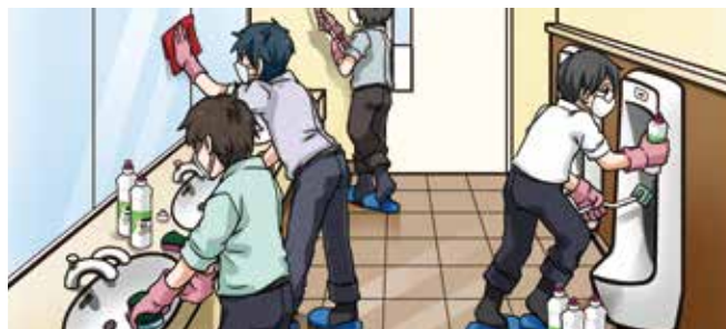
水回り / トイレ / キッチン / 浴室

持ちやすいサイズで、特に溝や凹凸がある表面に対して有効な清掃ツールです。プロ清掃用のツールとしてお使いください。