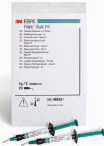
Filtek™ Bulk Fill Resina Fluida– Jeringa

REPUESTO EN JERINGAS: Incluye 2 jeringas de 2 g, 20 puntas dispensadoras, guía técnica, instrucciones de uso.