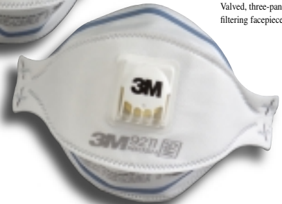
Valved, three-panel filtering facepiece respirator