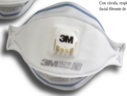
Con válvula, respirador pieza facial filtrante de tres paneles