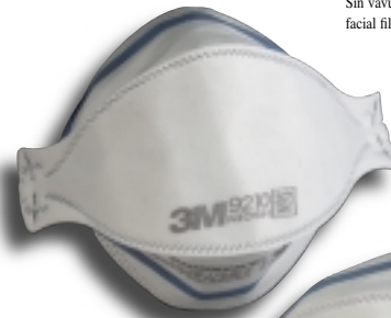
Sin válvula, respirador pieza facial filtrante de tres paneles