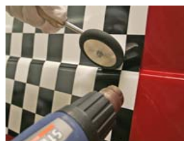
Grande roulette d'application

Ces outils manuels, qui facilitent le moulage de la pellicule chauffée dans les rainures de nombreuses carrosseries, sont essentiels pour appliquer la pellicule IJ380Cv3 dans les rainures et les cannelures difficiles à atteindre que l'on trouve sur les fourgonnettes Sprinter, de même que sur d'autres véhicules. Comparativement à la raclette traditionnelle, ces outils permettent de gagner beaucoup de temps au moment d'appliquer les graphismes dans les rainures.