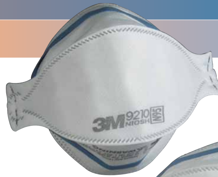
Sin válvula, respirador pieza facial filtrante de tres paneles