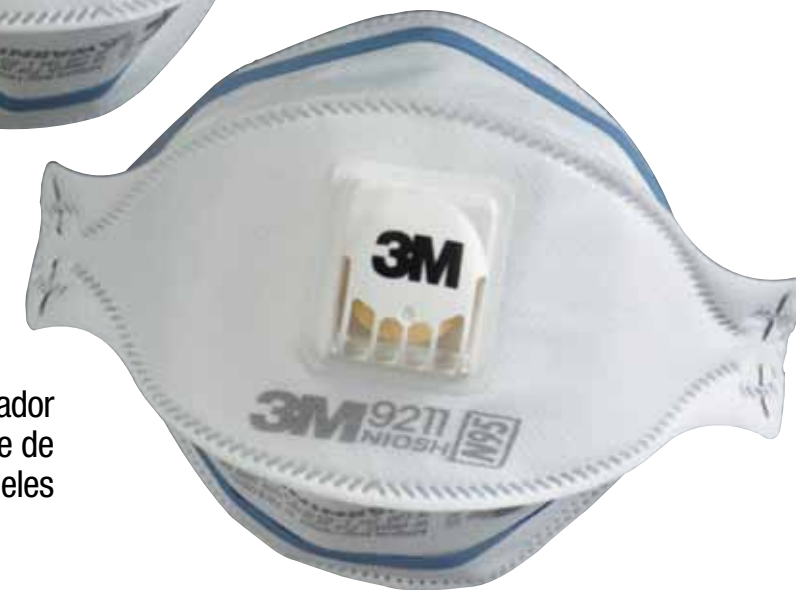
Con válvula, respirador pieza facial filtrante de tres paneles