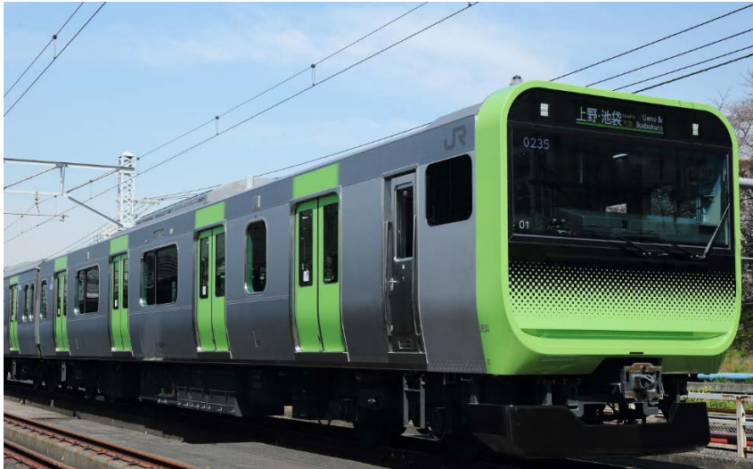
山手線 E235 系通勤形車両

従来の透明フィルムは屋外でステンレスに貼ると、フィルムが短期間で劣化してしまうことから、ステンレス製の鉄道車体には透明フィルムでデザインを施すことは困難とされていました。