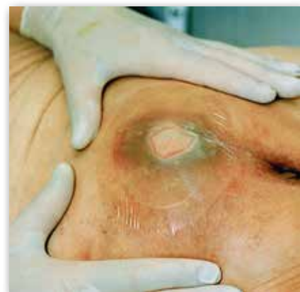
Såret kan inspekteras genom förbandet.

Vid kontakt med sårvätskan blir den hydrokolloida delen i förbandet som en gel vilket skapar en fuktig sårhämningsmiljö som främjar sårhämningsmiljön.