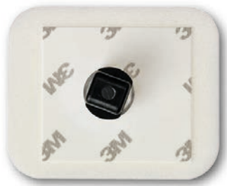
2228BA Skum Klibbande gel. 3 dygn. Banankontakt 4 mm.