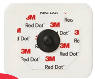
2570 Skum Klibbande gel. 5 dygn. Röntgentransparent. Kan användas i MR miljö.