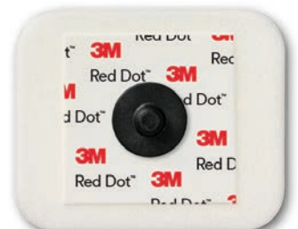
2244 Skum Klibbande gel. 3 dygn. Röntgentransparent. Kan användas i MR miljö.