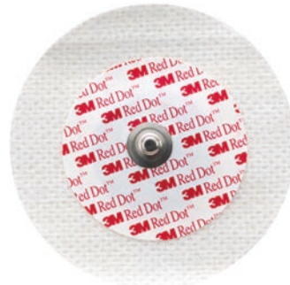
2238 / 2255 Mjuk textil Fast gel. 2 dygn. Finns med slippapper (2255).