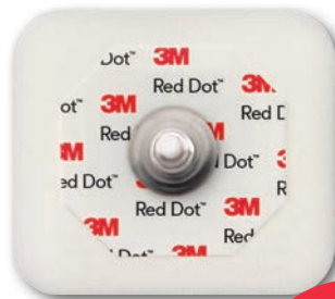
2560 Skum Klibbande gel. 5 dygn.