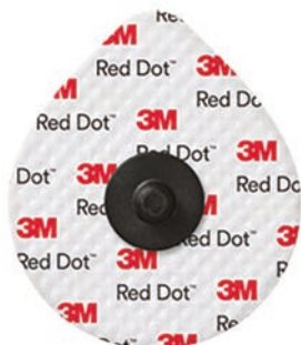
2268-3 Mjuk textil Fast gel. Spädbarn, 2 dygn. Röntgentransparent.