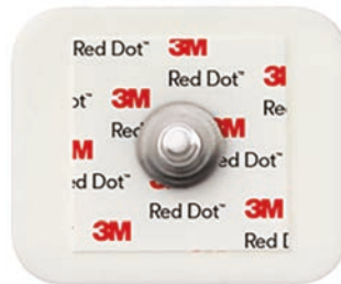
2228 Skum Klibbande gel. 3 dygn.