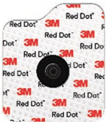
2660 Textil Konduktiv klibbande gel. 3 dygn. Röntgentransparent. Kan användas i MR miljö.