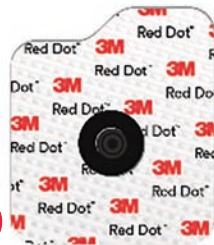
2670 Textil Konduktiv klibbande gel, extra kraftig häfta. 3 dygn. Röntgentransparent. Kan användas i MR miljö.