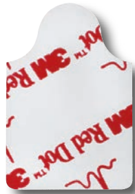
2330 Polyester Konduktiv klibbande gel. 2 dygn. För krokodilklämma.